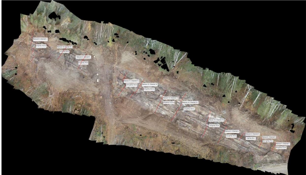
Figure 1: Orthomosaïque avec les rainures

Lors de la première phase de décapage (Décapage 2 et 3), L'intersection la plus significative obtenue provient du décapage no 2, 22,7 g/t d'or sur 7 mètres, incluant 161,9 g/t d'or sur 0,5 mètre; Une étude pétrographique réalisée a confirmé la présence de grains d'or dans la pyrite. L'or est généralement spatialement associé aux pyrites et est parfois (mais rarement) libre et situé dans des veines et veinules de quartz. Cette dernière observation confirme que la présence de veine de quartz n'est pas le vecteur principal pour la minéralisation aurifère du secteur Cartwright.