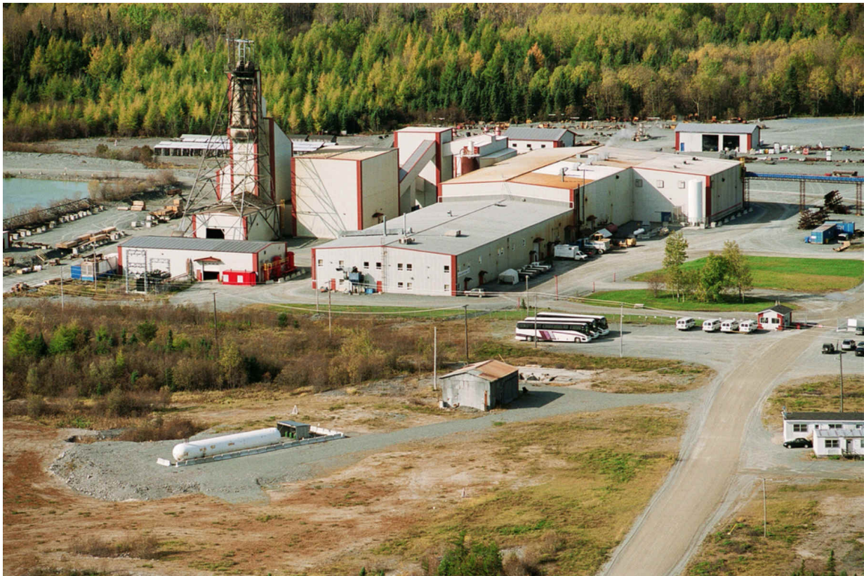
Installation de surface de la mine Géant Dormant

Parmi les actifs dont Abcourt a fait l'acquisition, il y a l'usine avec une capacité de traitement de 700 à 750 tonnes de minerai par jour, soit environ 250 000 tonnes par année. Cette capacité est suffisante pour traiter la production de la mine Elder et la production éventuelle de Géant Dormant. Le procédé utilisé est celui de charbon dans la pulpe. Il y a aussi une installation de gestion des résidus de l'usine, ainsi que des infrastructures souterraines comprenant deux puits, des galeries attenantes, un atelier de mécanique, des bureaux, un magasin, des salles de séchage, de l'équipement miniers, des installations de surface, un inventaire de pièces important, quatre (4) baux miniers et quarante (40) cellules attenantes à la mine.